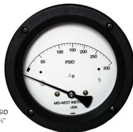
Модель 124 Давление 0-300 PSID Круговая шкала 4 1/2"

Опционная указательная стрелка максимального давления обеспечивает автоматическое указание максимального перепада, возникающего в промежутке времени или в системном цикле.