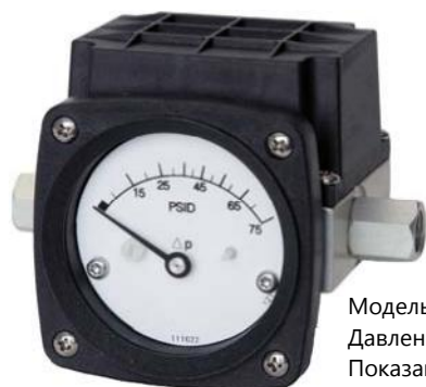
Модель 124 Давление 0-75 PSID Показано с концевыми (торцевыми) соединениями и с трансмиттером

Вариант с трансмиттером -20°F(-28°C) до +150°F(+65°C)