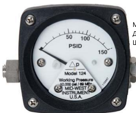
Модель 124 Давление 0-150 PSID Шкала 2 1/2"

Недорогой дифференциальный манометр для использования в измерениях перепада давления на фильтрах, сетчатых фильтрах, сепараторах, клапанах, насосах, холодильных установках, и т.д., и для местной индикации и регулировки