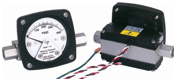
123 0-400 PSID