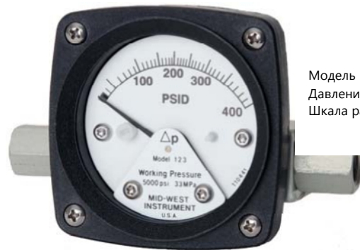
Модель 123 Давление 0-400 PSID Шкала размером 2 1/2"

Недорогой дифференциальный манометр для использования в измерениях перепада давления на фильтрах, сетчатых фильтрах, сепараторах, клапанах, насосах, холодильных установках, и т.д., и для местной индикации и регулировки расхода.