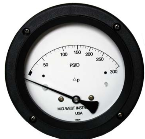
123 0-300 PSID 4 1/2"

Опционная указательная стрелка максимального давления обеспечивает автоматическое указание максимального перепада, возникающего в промежутке времени или в системном цикле.